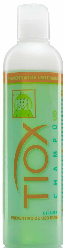
Envase de 250 ml