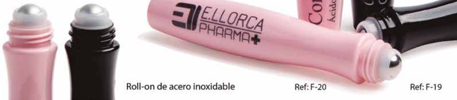
Roll-on de acero inoxidable